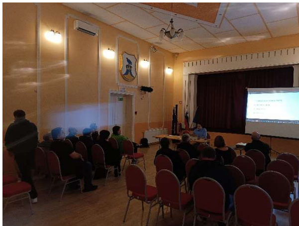
Utrinek iz javne razprave

Nadalje je bila izvedena javna razprava z občani na temo današnjega stanja prometa in pričakovanih prometnih rešitev za prihodnost. Izvedena je bila anketna raziskava za splošno javnost z naslovom »Zadovoljstvo s stanjem prometa v Občini Bistrica ob Sotli« in anketna raziskava glede potovalnih navad zaposlenih v večjem podjetju v občini. Prav tako so bili opravljeni terenski ogledi s ciljem ocenjevanja pogojev za hojo in uporabo kolesa, za vodenje cestnega prometa, upravljanja z mirujočim prometom in uporabo storitev javnega potniškega prometa.